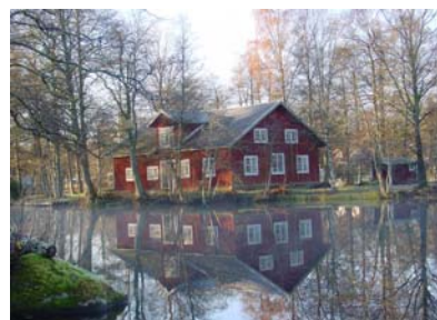
Sjövillan i Åby

Rotarna Ekna, Gunnarstorp, Lerike, Nykulla, Skavenäs, Tjureda, Åby