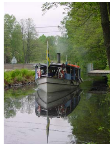
Ångaren Thor passerar svängbron i Åby sluss